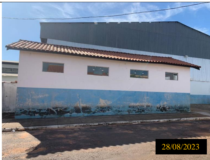
Figura 02: Local: terreno destinado ao empreendimento.