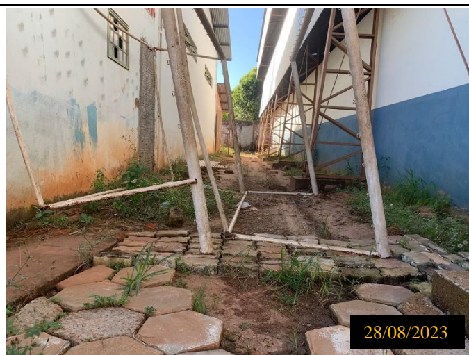
Figura 05: Local: terreno destinado ao empreendimento.