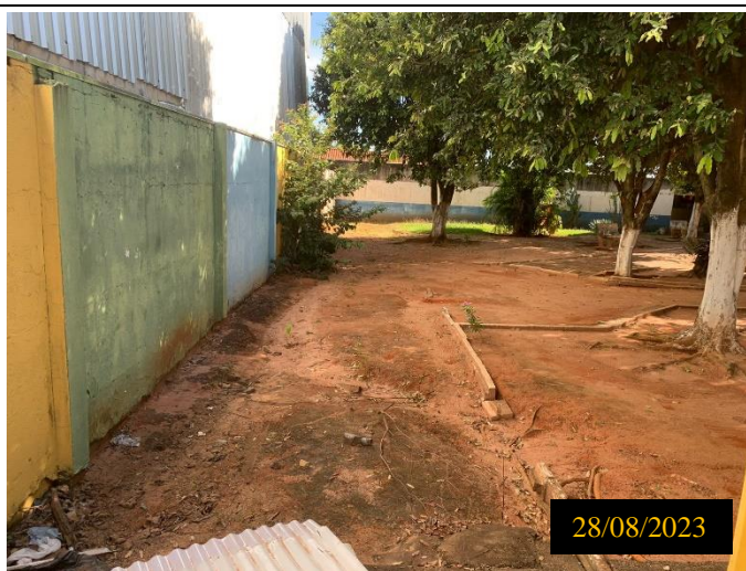
Figura 04: Local: terreno destinado ao empreendimento.