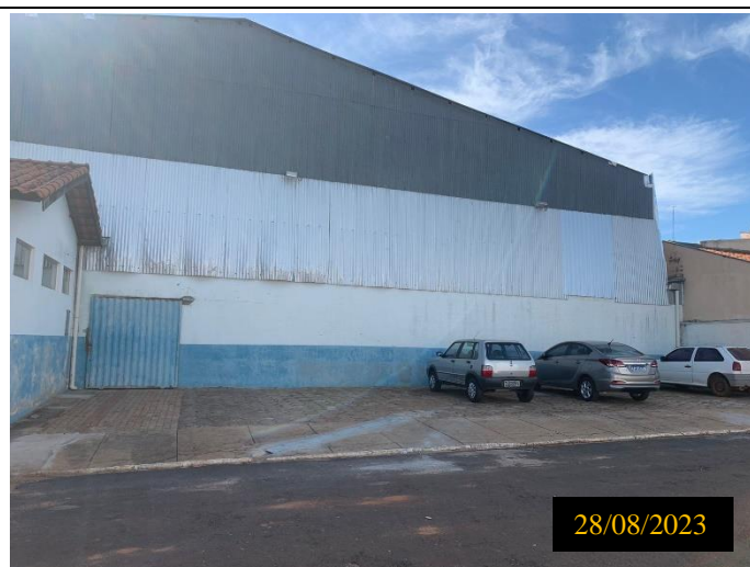
Figura 01: Local: terreno destinado ao empreendimento.