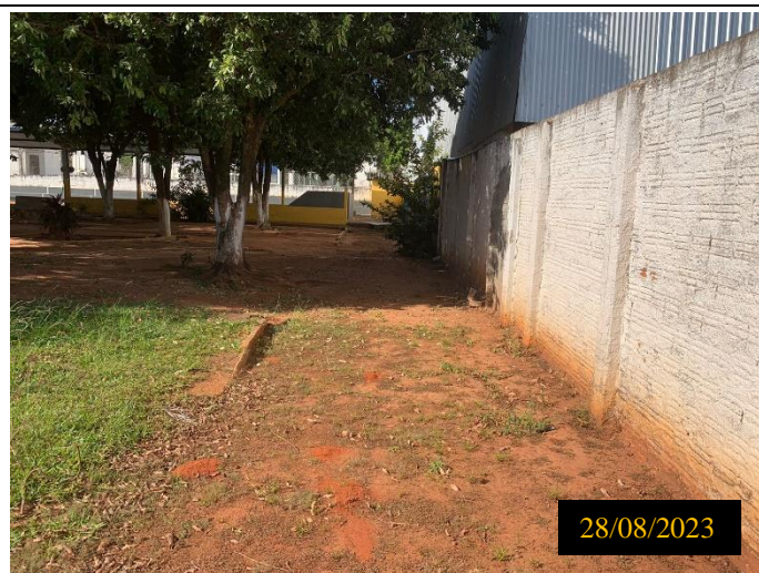
Figura 03: Local: terreno destinado ao empreendimento.