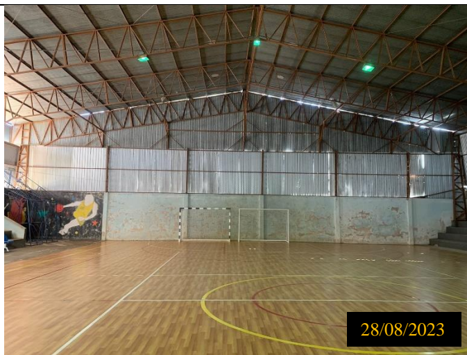
Figura 06: Local: terreno destinado ao empreendimento.