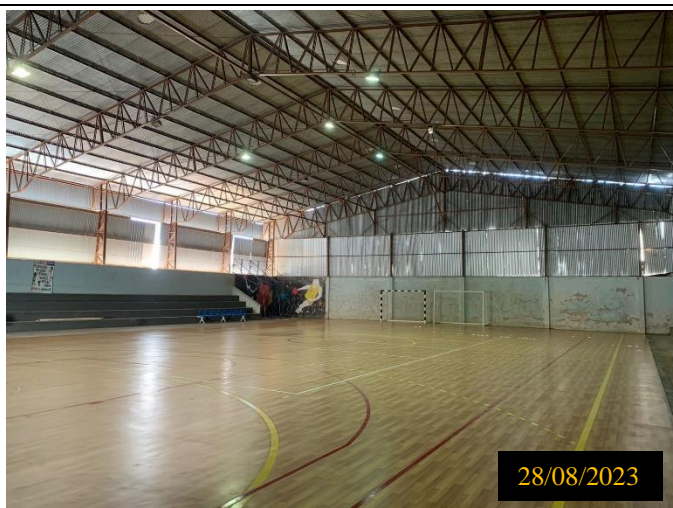
Figura 08: Local: terreno destinado ao empreendimento.